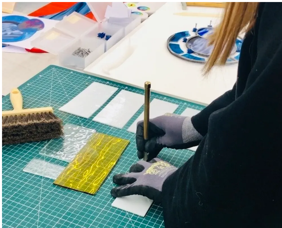
Le fameux outil "coupe-verre".