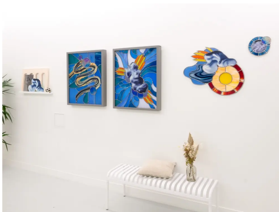
Vue des œuvres de Violaine Carrère, exposition "Jardin d'hiver".

L'exposition " Jardin d'hiver " est à visiter à la Galerie Bessaud jusqu'au 20 décembre 2024.