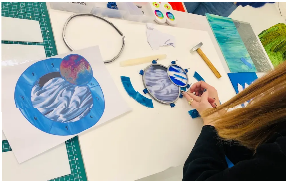
Assemblage du puzzle.

Il s'agit de la réouverture du musée de Cluny , dans le 5 e arrondissement parisien, et de l'ouverture de la Cité du vitrail , à Troyes.